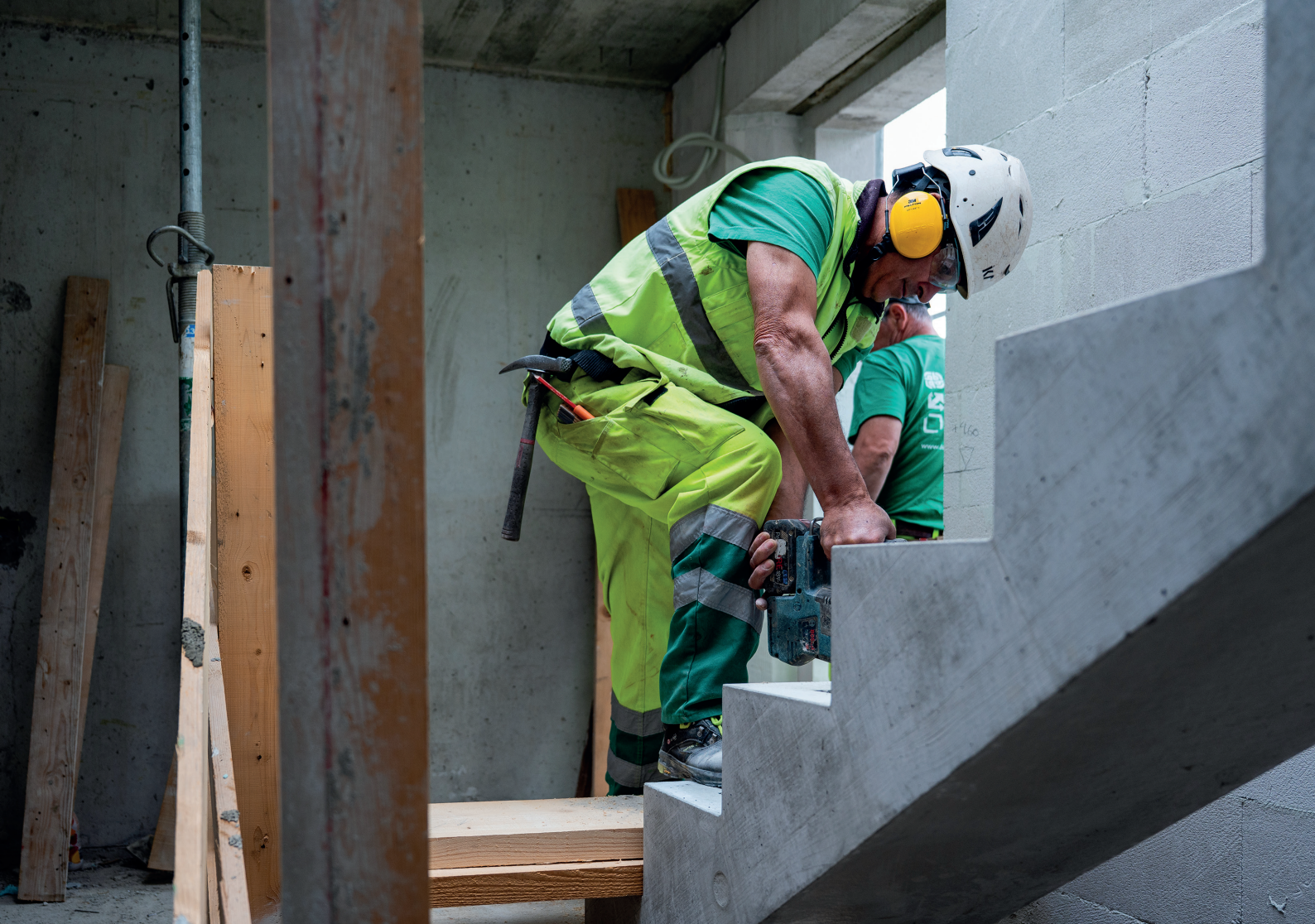
Hölzerne Zwischentritte: Die vorgefertigte Treppe erhält ihre Stufen erst nach Abschluss des Rohbaus.