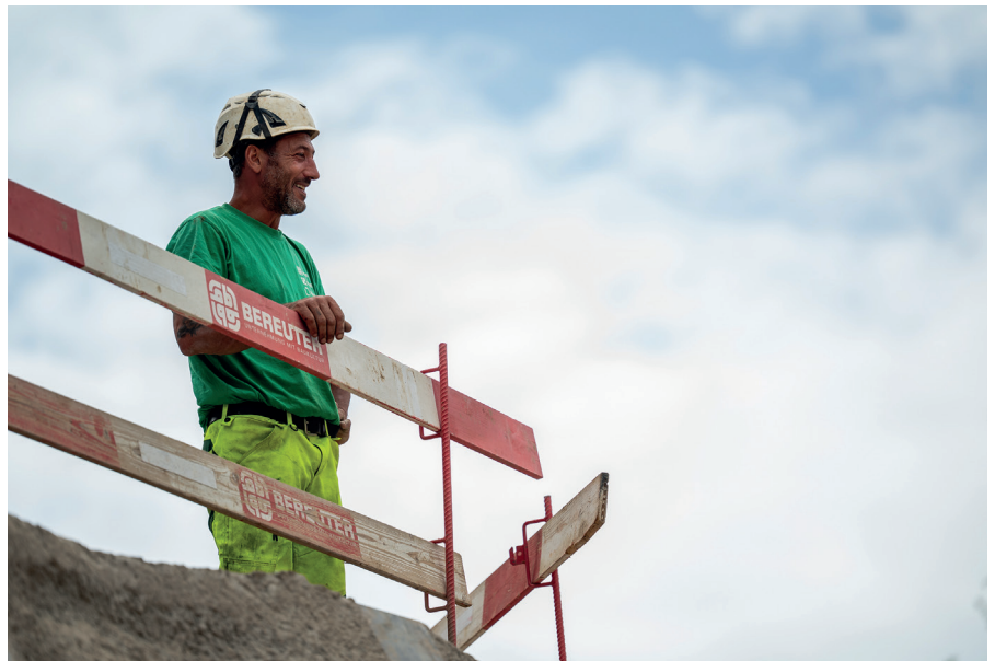
Gute Laune und gute Leistung: Die BGT-Truppe führt beides zusammen.

tungsmassnahmen nötig sind.» Zum Einsatz kommt ein Wellpoint-System, welches das Grundwasser im Bereich der Baugrube temporär absenkt. Diese frühe Sicherheit war wertvoll: Die Arbeiten laufen kontrolliert und ohne Unterbrüche. Wäre man von der wasserführenden Schicht überrascht worden, hätte das die Grubenarbeiten empfindlich verzögert und verteuert.