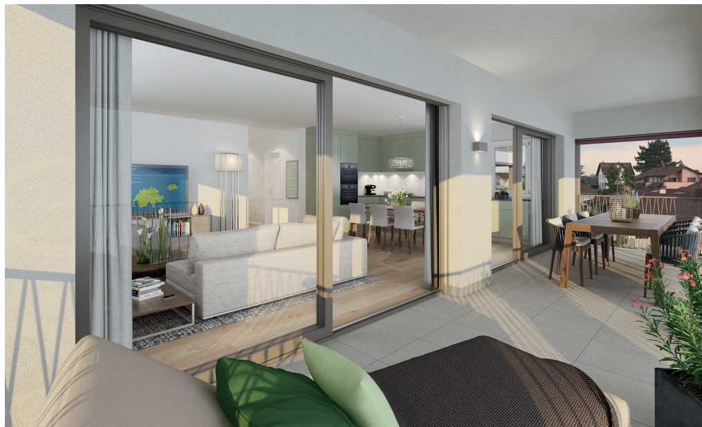
Alle Wohnungen verfügen über direkten Balkon- oder Sitzplatzzugang.

Baufreigabe, sollen die Bauarbeiten im Herbst dieses Jahres starten. Ausgeführt werden sie durch die Bereuter Baugrubentechnik AG sowie die Bereuter Bau AG. Bezugsbereit könnten die insgesamt 23 neuen Wohnungen im Herbst 2028 sein.